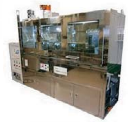
有機ドラフトの設計・製作

当社は、グループ会社であるJOHNAN株式会社や関西セイキ工業株式会社と連携し、PLC制御設計・回路設計以外にも装置の開発設計・部材調達・製作をワンストップでご提供します。量産品も対応可能です。